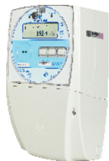
МИР С-04 трехфазный внутренней установки Inom (Imax) = 5(100A)