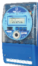
МИР С-07 трехфазный Inom (Imax) = 5(10A)