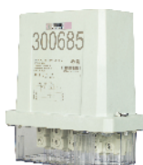
МИР С-04 трехфазный наружной установки Inom (Imax) = 5(100A)