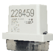
МИР С-05 однофазный наружной установки Inom (Imax) = 5(80A)