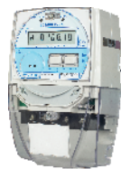
МИР С-05 однофазный внутренней установки Inom (Imax) = 5(80A)